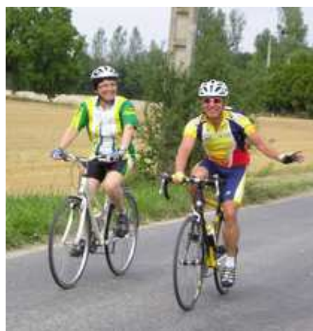
Sortie ASPTT Epernay