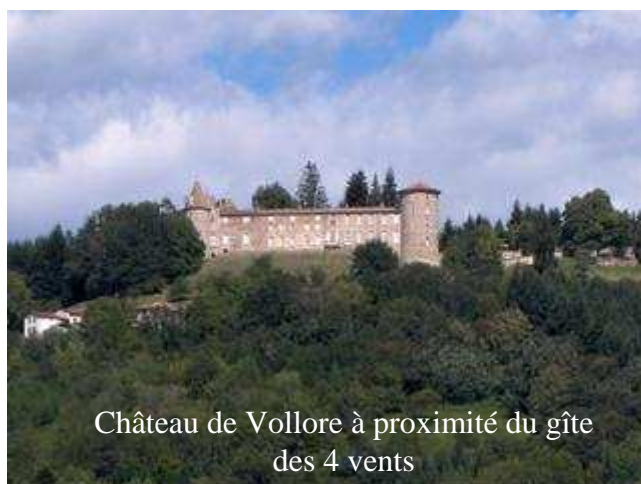
Château de Vollore à proximité du gîte des 4 vents