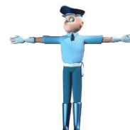
Obligation de s'arrêter et d'attendre qu'il donne l'ordre de passer.